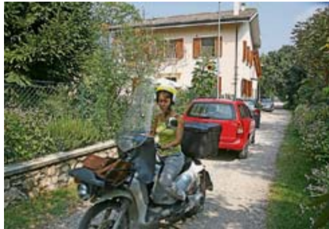
La casa dove abitava Guglielmi in via Falcona