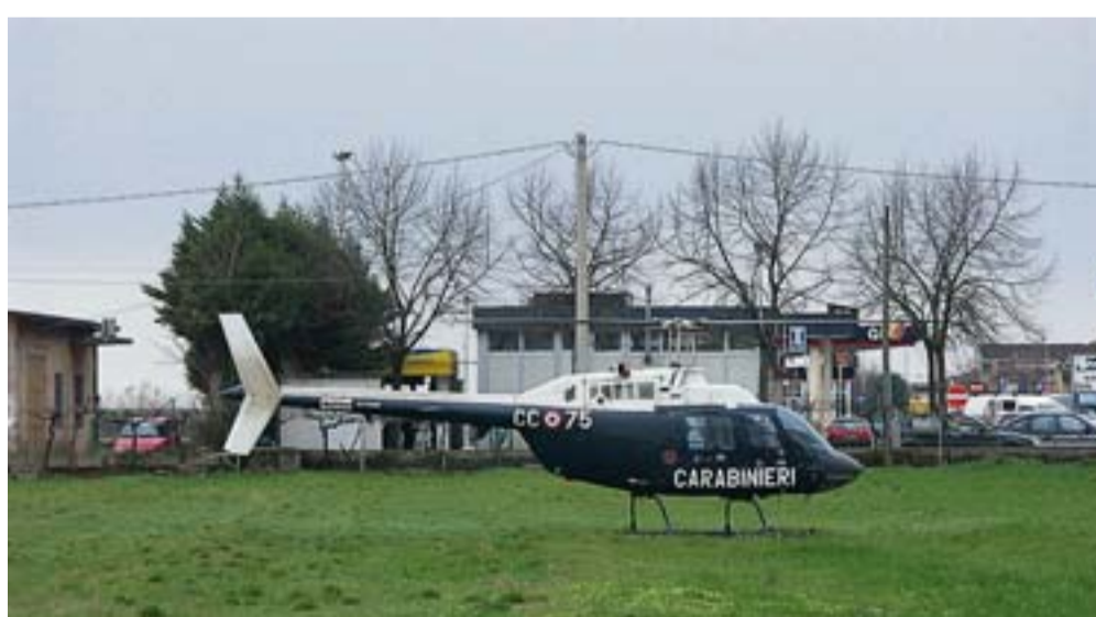
L'elicottero dei carabinieri all'uscita del casello autostradale a Sommacampagna

un tasso alcolico tra il 2.43 e 2.46. Per questa violazione è stata prevista l'ammenda da 1.500 euro a 6 mila, l'arresto fino a sei mesi nonché la sanzione amministrativa accessoria della sospensione della patente di guida da uno a due anni. Inoltre, avendo provocato un incidente stradale, le pene di cui sopra sono raddoppiate ed è disposto il fermo amministrativo del veicolo per novanta giorni;